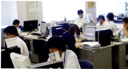
当社オフィス風景「ORC(オーク)200」